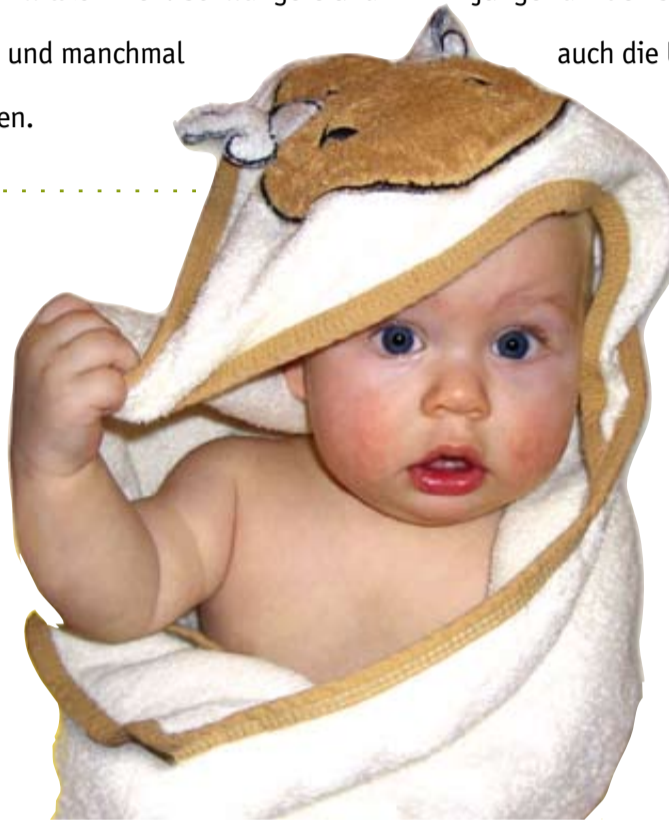
Glückliche und gesunde Kinder in Kassel – das ist das Ziel des Projektes „Willkommen von Anfang an – Gesunde Kinder in Kassel“.

Was verbirgt sich nun aber im Detail hinter dem Projekt? Zweierlei, denn das Projekt bündelt zum einen die vielfältigen Informations-, Beratungs- und Hilfeangebote für Schwangere und Familien, die es in Kassel bereits gibt, und fördert zum anderen die Abstimmung zwischen den unterschiedlichen Anbietern bzw. Trägern. Insgesamt sind es bereits